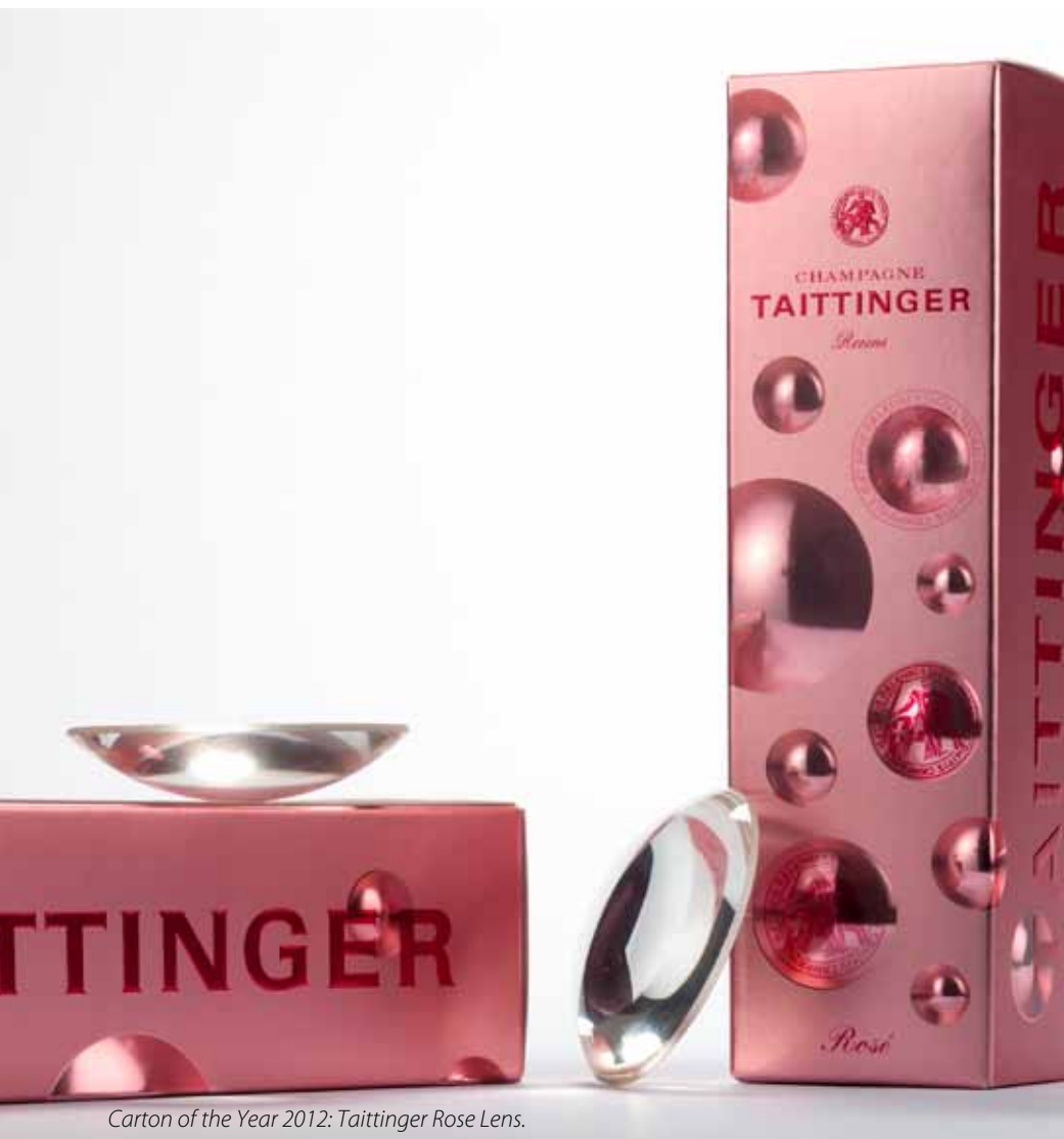
Carton of the Year 2012: Taittinger Rose Lens.