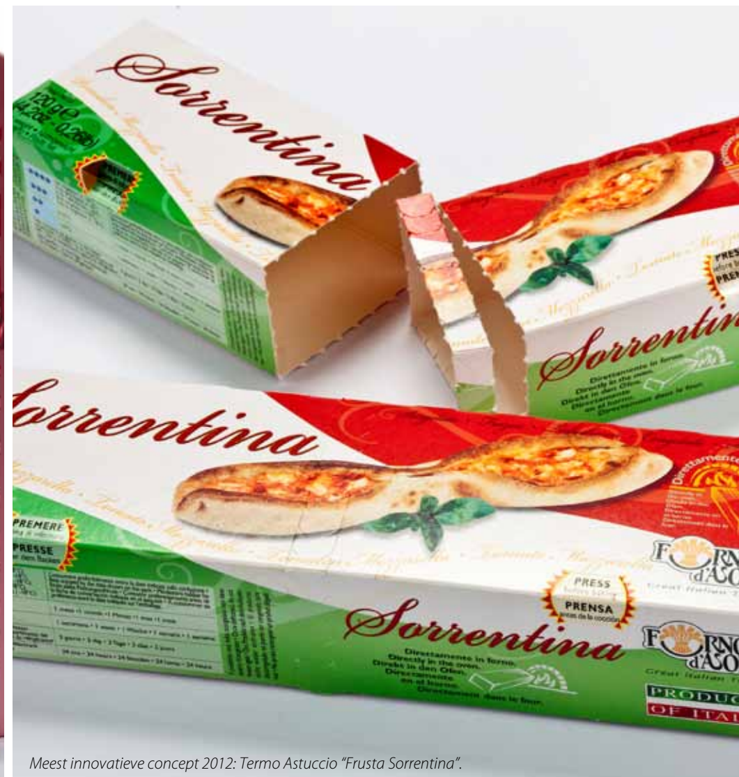
Meest innovatieve concept 2012: Termo Astuccio "Frusta Sorrentina".