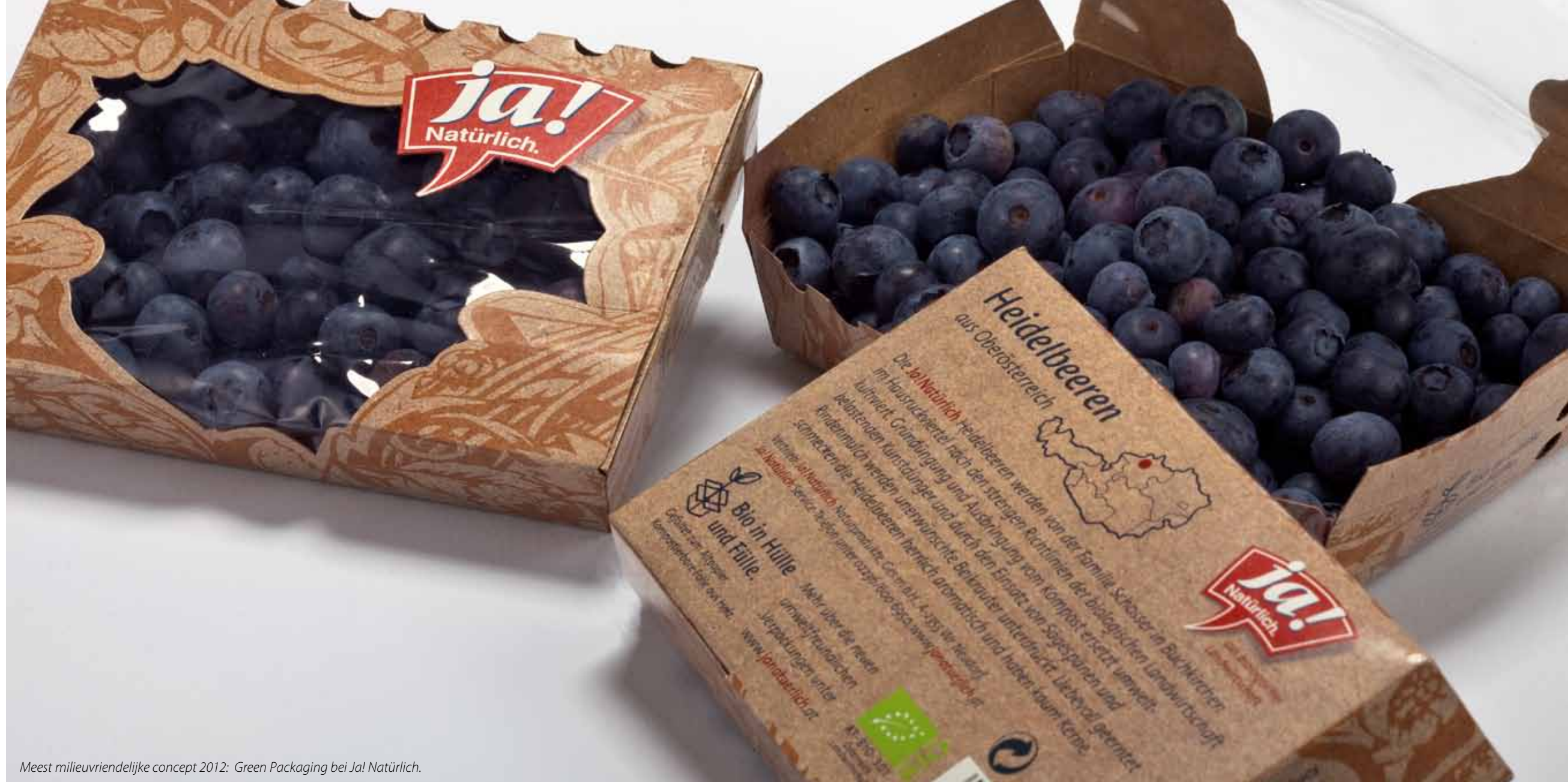
Meest milieuvriendelijke concept 2012: Green Packaging bei Ja! Natürlich.