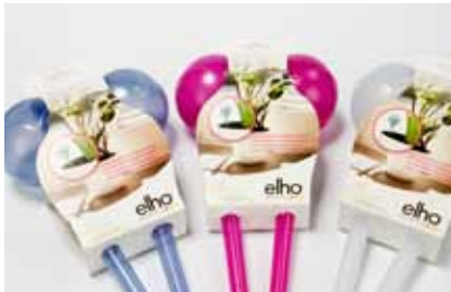
Acket drukkerij kartonnage bv WINNAAR cat. All Other Non-Food