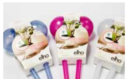
All Other Non Food