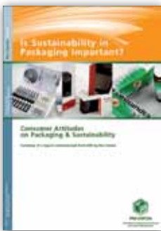
Is Sustainability in Packaging Important?

Download nu ook gratis de volgende interessante publicaties van Pro Carton!