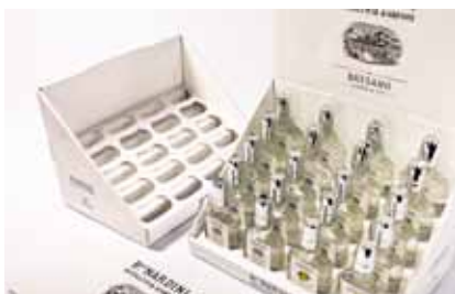
Shelf Ready & Display