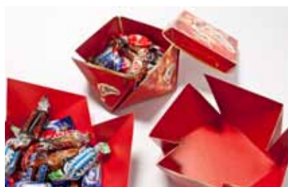
Volume Market Cartons