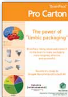
Limbic packaging report