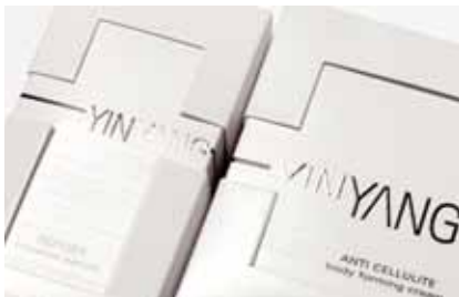
Beauty & Cosmetics