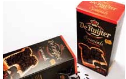
Acket drukkerij kartonnage bv FINALIST categorie All Other Food

Pro Carton en ECMA organiseren jaarlijks een gezamenlijke, internationale Carton Award Competition. De Pro Carton / ECMA Awards voor uitmuntende vouwkarton verpakkingen zijn dit jaar voor de vijftiende keer toegekend. De prijswinnende concepten van de afgelopen jaren hebben velen geïnspireerd tot verdere ideeën en innovaties. Met name duurzaamheid en gebruiksvriendelijkheid van de vouwkarton verpakking spelen een steeds grotere rol voor de consument.