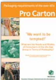
Packaging Requirements of the over 60's