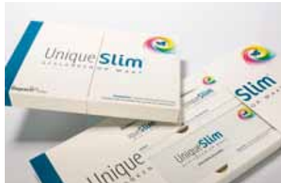
Intergrafipak B.V. WINNAAR categorie Pharmaceutical