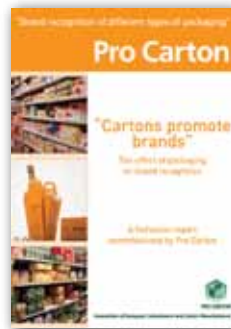
Cartons promote brands