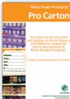
The Retail Ready Packaging report