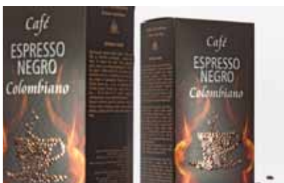
All Other Food