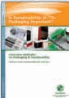
Is Sustainability in Packaging Important?