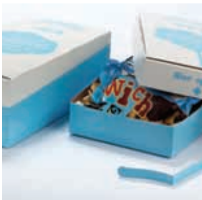
Shelf Ready & Display