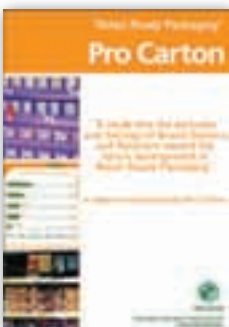
The Retail Ready Packaging report