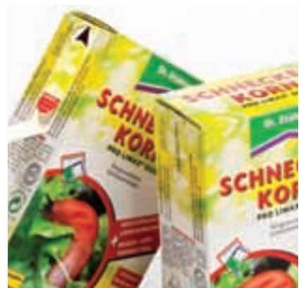
All Other Non Food