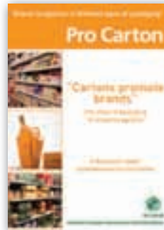
Cartons promote brands