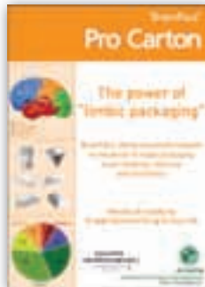
Limbic packaging report