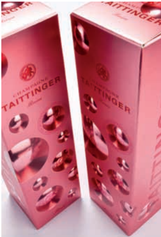
Carton of the year

Official name of entry: Taittinger Rose Lens Entrant: Carton Producer: VG Angoulême Brand Owner: Taittinger Structural Designer: VG Angoulême Graphic Designer: Taittinger Cartonboard manufacturer: Iggesund Paperboard, Mayr-Melnhof Karton