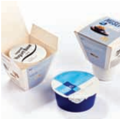
All Other Food