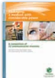
Packaging: a medium with considerable power

Deze publicaties kunt u als PDF gratis downloaden op de website www.procarton.com onder de sectie 'publications' en 'reports and studies'.