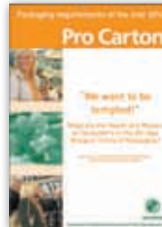
Packaging Requirements of the over 60's