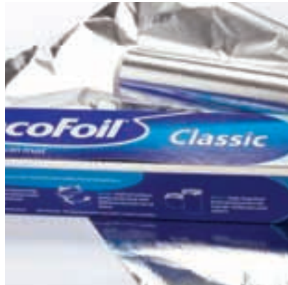
Volume Market Cartons