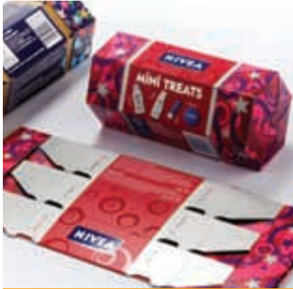
Beauty & Cosmetics